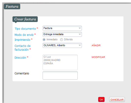
Figura 2. Selección de contacto de facturación y modo de envío.

Acto seguido se mostrará una ventana emergente en la que se muestra el tipo de documento, el modo de envío (seleccionar “Entrega inmediata” para que se genere el PDF) y el contacto de facturación (en principio no se deberá de cambiar salvo que el cliente lo requiera). Finalmente pinchamos en OK y se generará la factura en PDF.