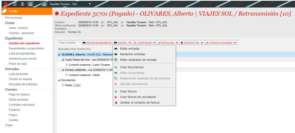
Figura 3. Creación de una factura de un pedido a nombre de una estructura.

El inicio del proceso es exactamente el mismo que el descrito en el punto anterior (localizar el pedido y pinchar en “Crear factura”).