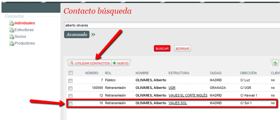
Figura 5. Selección del contacto de la estructura a incluir en la factura.

Esto hará que se abra una nueva ventana emergente en la que deberemos buscar el nombre de la persona de contacto que deseamos que aparezca. Una vez localizada, se selecciona y se pincha en “Utilizar contactos”.