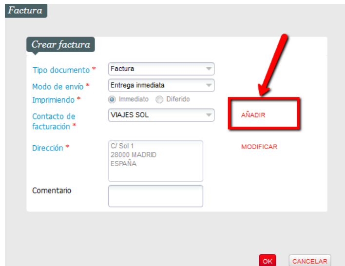
Figura 4. Cambio de contacto de facturación para añadir contacto de retransmisión de estructura.

Si deseamos la primera opción, en la ventana emergente deberemos pinchar simplemente en OK. En caso de desear la segunda opción, en la ventana emergente deberemos de cambiar el contacto de facturación ya que, por defecto, es la estructura sin el contacto. Para ello pinchamos en “Añadir” tal y como se muestra en la siguiente imagen.