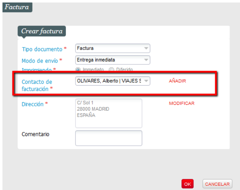
Figura 6. Factura que se generará a nombre del contacto y de la estructura.

Esto hará que se añada, tanto el nombre del contacto, como el nombre de la estructura, tal y como se observa en la imagen siguiente.